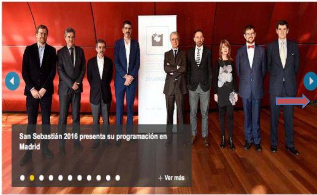
San Sebastián 2016 presenta su programación en Madrid + Ver más